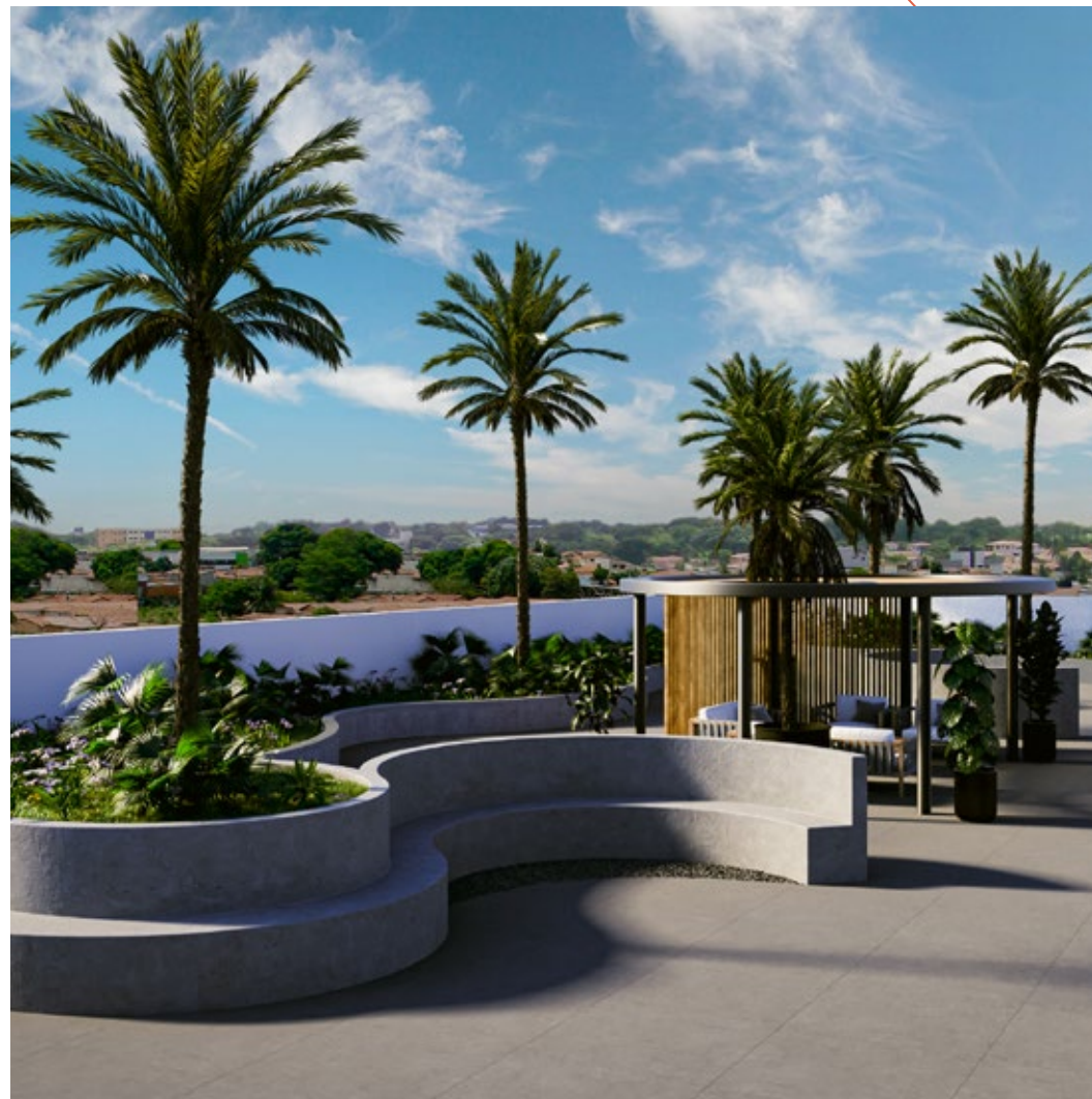
PRAÇA DE CONVIVÊNCIA