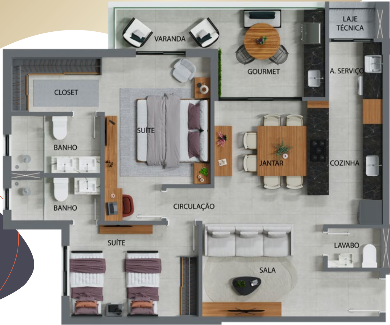
PLANTAS APTO TIPO