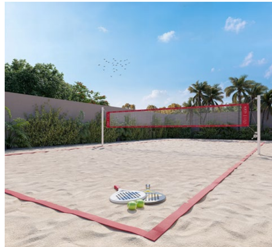
QUADRA DE BEACH SPORTS